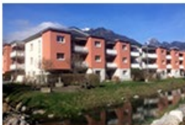
Farbwiesstr. 15 Niederumen