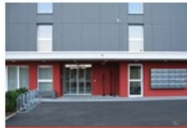
Letz 18, Näfels