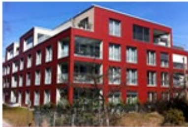
Denkmalweg 14 Näfels