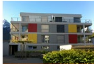
Zigerribi 4 Oberumen