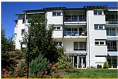
Letz 17, Näfels