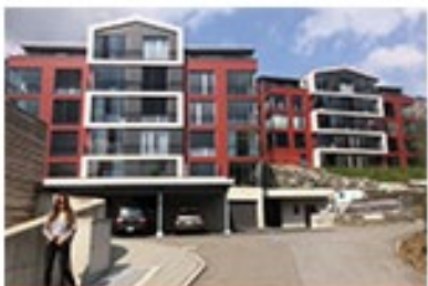
Obere Dorfstrasse Amden