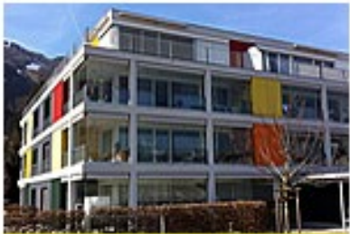
Zigerribi 2 Oberumen