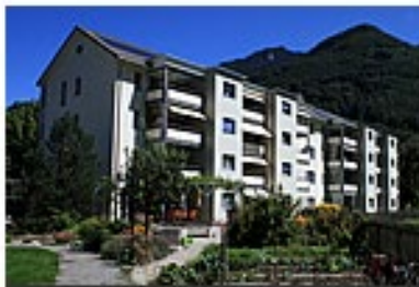
Letz 19, Näfels